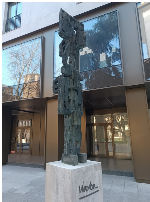
4. Mirko Basaldella, Totem , 1959.