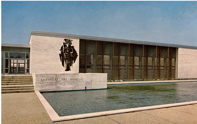
5. Mirko Basaldella, Initiation al Krannert Art Museum, Urbana, 1961.