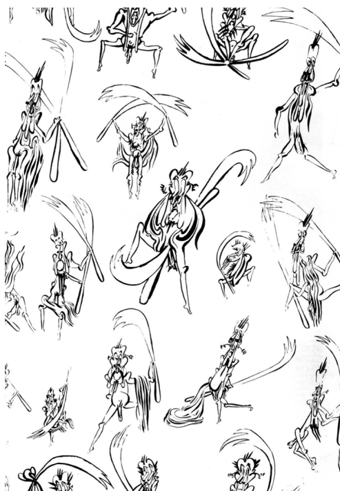
2. Francesco Clemente, Ritratti di spiriti , 1975-1976 (da DATA, a. 6, n. 23, ottobre 1976, p. 62). Courtesy l'artista.