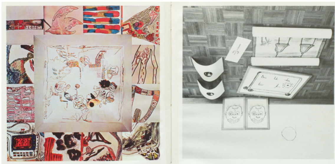
4. Francesco Clemente, Paesaggio sottosopra , 1977 (da Gratis , Centre d'art contemporain, Ginevra, 1978). Courtesy l'artista.

Nella seconda parte del lavoro, intitolato Mappe senza territorio , un disegno a inchiostro di un cappello, una cravatta, una giacca, dei pantaloni e una cintura, privi di indossatore, era diviso in sette parti da altrettanti ingrandimenti fotografici. In ogni dettaglio, un ritratto caricaturale riempiva una delle sagome del vestiario, in corrispondenza di ciascun chakra e delle rispettive personalità. Lo stile delle caricature sembra difficile da riferire a Clemente stesso, e l'ipotesi di una collaborazione rimasta anonima non sarebbe solo plausibile (alla luce di altri casi coevi) 28 ma introdurrebbe anche il tema dell'appropriazione, come sfida all'autografia dell'arte.