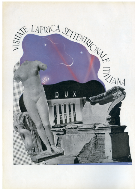
1. In Libia , 4, luglio 1937, p. 8.

compiute dall'allora governatore della colonia Emilio De Bono in occasione dell'inaugurazione della Fiera Campionaria di Tripoli, oltre a scene che illustravano gli scavi di Sabratha, le telecamere proponevano continuamente paesaggi desertici e palmeti. 34 In un altro filmato, intitolato Il trionfale viaggio di S. E. Mussolini in Tripolitania (1926), addirittura un'intera sequenza di montato era dedicata proprio agli alberi di palma, di cui venivano forniti dati informativi e statistici, e di cui si restituivano immagini fotografiche altamente suggestive. 35 Tali messaggi non erano di certo creati in maniera ingenua, ma erano piuttosto indirizzati a una diffusione propagandista di idee coloniali. Dal momento dunque che «una buona macchina di propaganda», come quella approntata attraverso documentari e cinegiornali dal Fascismo, «è una macchina di sogni», questi materiali audiovisivi dovevano suscitare speranze ed emozioni negli individui. [...] L'Africa raccontata al cinema offriva agli italiani molte opportunità per sognare. [...] Braccianti e nullatenenti potevano sognare all'idea di avere facile accesso al possesso di terre libere da coltivare [...], mentre i giovani potevano fantasticare su avventure in terre esotiche. 36