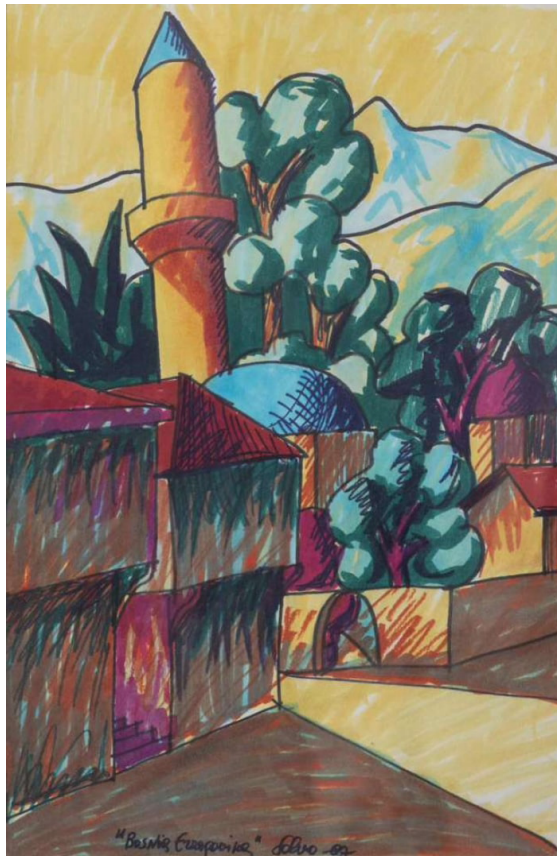
2. Salvo, Bosnia Erzegovina , 1987, pennarelli su carta, 45x30,4 cm.

La narrazione sulla capitale della Bosnia-Erzegovina evidenzia la sua complessità culturale e lascia intuire il fascino provato per una realtà talmente diversa e stratificata, ed è contestualizzata all’ottobre del 1988, quando le guerre jugoslave e l’assedio durato quattro anni erano ancora a venire. È comunque dal 1984 in poi che il soggetto viene ripetuto con consuetudine da Salvo, che precisa l’origine del luogo sul retro delle opere scrivendo “Bosnia Herzegovina” (sic!) e ritorna sul soggetto operando una serie di modifiche al tema. Nel 1985, a tale località è collegato il dipinto di una moschea incorniciata in una veduta sul mare, nel 1987 invece la prospettiva più tipica di Sarajevo è realizzata su carta e con pennarelli colorati [fig. 2]. Un dipinto intitolato direttamente Sarajevo (1993) è esposto nella mostra personale tenuta presso la galle-