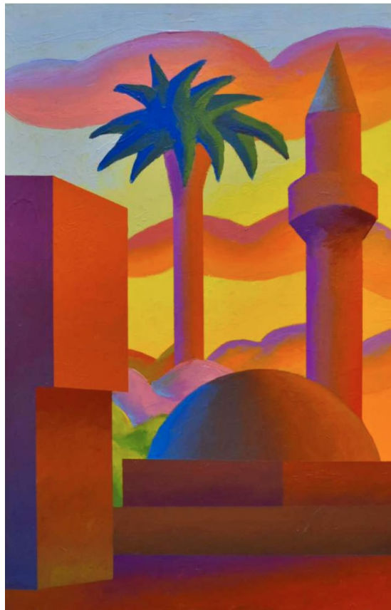
3. Salvo, Bosnia Erzegovina , 1991/1993, olio su cartone, 55,8x36 cm.

Nel 1993 Salvo ha realizzato altri dipinti sul medesimo soggetto e dai colori sgargianti, tra cui le opere intitolate Bosnia Erzegovina e datate l'una al 1991-1993, e altre due al 1993. Tutte le versioni presentano