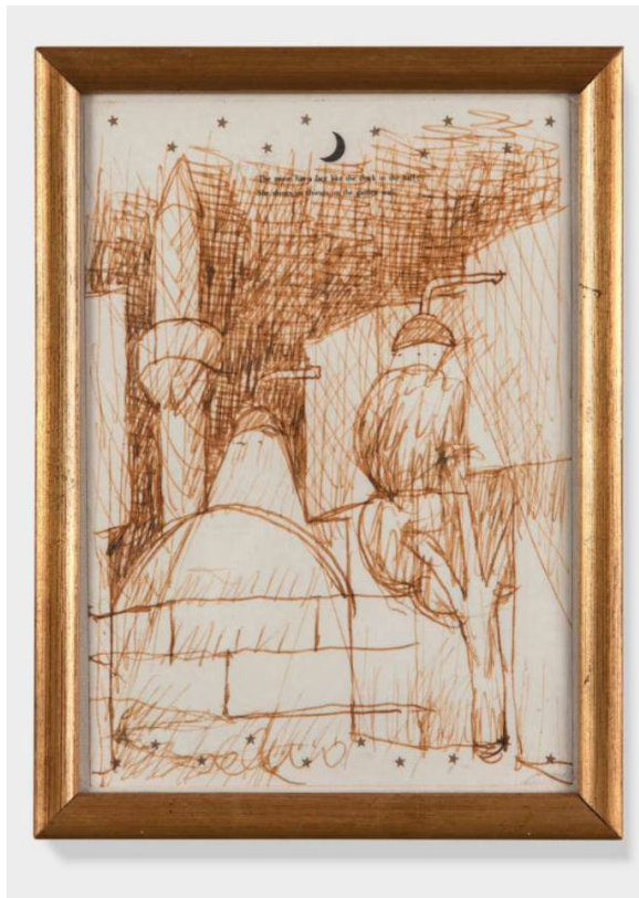
1. Salvo, Senza titolo , 1982, penna biro su carta intestata 14,4x10,2 cm.

dell'imperatore di Sarajevo. Accanto alla firma manca però l'indicazione sul luogo ritratto, mentre in alto capeggia un'illustrazione stampata raffigurante una luna e un breve estratto dalla poesia The Moon di Robert Louis Stevenson: «The moon has a face like the clock in the hall; She shines on thieves on the garden wall». La stessa tipologia di foglio è stata usata per altri disegni di paesaggi da Salvo, anche per scenari diurni. La Moschea dell'imperatore è un soggetto molto indagato dall'artista, quale edificio tratteggiato e descritto da più angolazioni, in diverse ore del giorno e sotto molteplici condizioni climatiche, inserito in composizioni che riportano porzioni di altri edifici e piante variegata a incorniciarla. Edificio centrale del culto musulmano cittadino e dal riconosciuto valore religioso e storico, è la prima moschea costruita sul territorio dopo la conquista ottomana, per questo un luogo di interesse storico e un elemento centrale nella riflessione su Sarajevo. Raccontando di un viaggio programmato ma interrotto alla frontiera per passaporto scaduto, Salvo intesse uno scherzoso paragone tra Sarajevo e Perpignano mentre si confronta con Leonardo Sciascia cui la lettera è destinata.