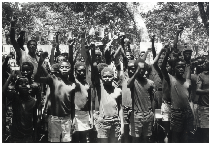
2. Bruna Polimeni, Ragazzi in un villaggio delle zone liberate , 1971.

Ne è un esempio uno scatto in cui Polimeni ritrae dei giovani di un villaggio delle zone liberate: i soggetti sono in piedi di fronte all'obiettivo, alcuni lo guardano direttamente, quasi come fossero schierati, mentre alzano in alto i pugni chiusi in segno di lotta. Nella fascia superiore dell'immagine intravediamo gli alberi che circondano i ragazzi e che, visivamente, ci riportano alla foresta, mentre il posizionamento e l'atteggiamento dei protagonisti trasmette decisione e unione, elementi