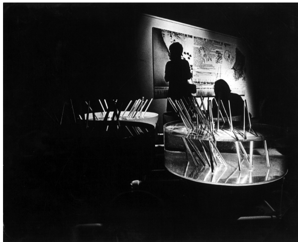
3. Laura Grisi, Rifrazione , 1968, Earth Air Fire Water-Elements of Art, Museum of Fine Arts Boston,

1971, © Laura Grisi Estate, Roma e P420, Bologna.