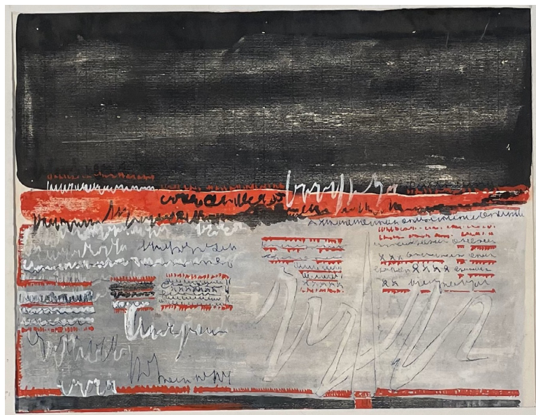
1. Laura Grisi, Senza titolo , 1962, © Laura Grisi Estate, Roma.

È soprattutto la riproduzione del Centre Pompidou a poter essere messa a confronto con una gouache realizzata nel 1962 e conservata nell'Archivio Laura Grisi [fig. 1]. 28 Particolarmente simili per composizione e per la presenza di una scrittura estremamente libera, nell'esemplare dell'archivio dell'artista si rileva però una prima comparsa di minuziosi segni grafici che si sedimentano sulla superficie pittorica. L'elaborazione di un più vasto campionario calligrafico a partire dal 1962 sembra evidenziare un ripensamento nei confronti di forme grafiche estranee al sistema di scrittura occidentale. Simile sviluppo appare verosimilmente connesso alle suggestioni visive raccolte durante il soggiorno in Polinesia, ma anche alle esperienze maturate nei precedenti viaggi in Africa. Nel 1960 Grisi aveva infatti visitato Ciad, Camerun e Tunisia e sarebbe tornata nel continente africano tra il 1963 e il 1964, attraversando la Nigeria, l'Alto Volta (oggi Burkina Faso), il Niger, il Dahomey (oggi Benin) e il Togo, 29 entrando probabilmente in contatto con molteplici sistemi simbolici e grafici lontani dalla tradizione europea.