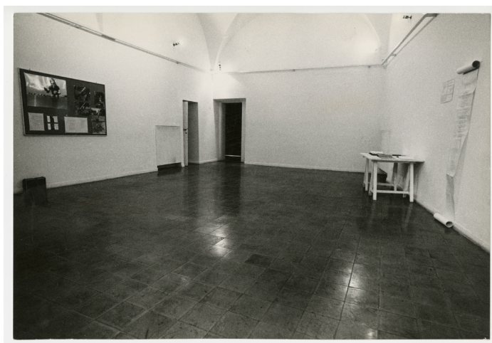
5. Massimo Piersanti, Mappa 72 , Roma, Centro Archivi MAXXI Arte, AIIA/AT/AI/008.