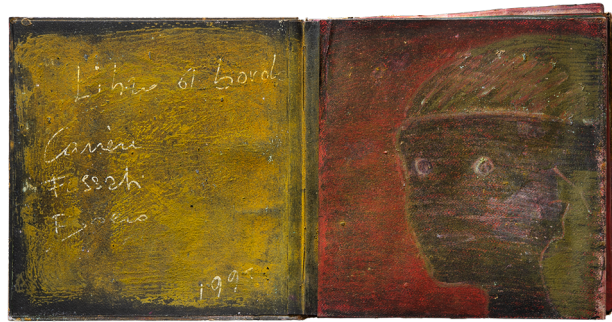
1. Renata Boero, Africa , 1995.