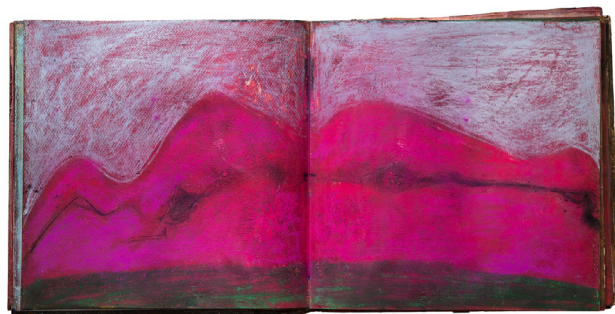
4. Renata Boero, Africa , 1995.

Nella sua ricerca echeggiano molti elementi familiari al lessico delle avanguardie del dopoguerra: l'impronta, la tela liberata dal telaio, la modularità e la performatività del processo artistico. È pienamente nello spirito dei tempi anche nel momento di "verifica ambientale" del proprio procedimento con le azioni presso i Cantieri Baglietto di Varazze nel 1976. Eppure nei Cromogrammi di Renata Boero, e nelle più recenti Ctoniografie , risuona una memoria più arcaica, un senso del vissuto talvolta logoro e consunto, che non è solo formalisticamente concettuale ma compromesso con la vita più di quanto le dichiarazioni dell'artista stessa non ammettano. In un testo del 1976 intitolato Regesto , in anni cruciali per lei che precludono direttamente alla partecipazione alla Biennale di Venezia del 1982, dichiarava infatti di aver deliberatamente abolito il rapporto diretto con la pittura per giungere alla «concentrazione di un procedimento operativo concreto» cercando di limitare il proprio intervento «al calcolo del tempo esatto di