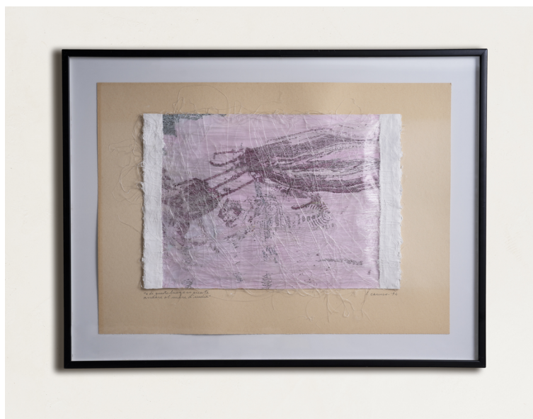
5. Luciano Caruso, La via della seta: e di questo luogo si puote andare al mare d'India , 1994, tempera, china e filo di seta su plastica, 68x48,5 cm.

precisi significati simbolici, magici ed esoterici e possiede la capacità di citare se stessa, ovvero l'alterità, l'esoticità e i racconti che anima, ponendosi come un invito alla scoperta dell'Oriente. 42 Al contempo il filo, chiarisce Gio Ferri, «non è solo metafora del viaggio, del suo contorto progetto interiore, bensì è, essenzialmente, metafora di sé come linea», 43 una linea in quanto origine e matrice di ogni scrittura, «cosicché il viaggio medesimo, che ricomincia sempre da capo (da un capo all'altro del filo) è quello stesso segno primitivo che il viaggiatore va cercando» 44 convinto che la meta stessa sia il percorso e non la sua destinazione finale. Lo stesso filamento è protagonista de La via della seta. E di questo luogo si puote andar al mare d'India (1994) [fig. 5] dove, disteso sulla superficie dell'opera, traccia percorsi di rotte marittime, proprio come il medesimo di spago impiegato in La via della seta: Cianghi ch'è molto grande e bella, e hae molte cose come l'altre (1994) e La via della seta – della città d'Escier (1999).