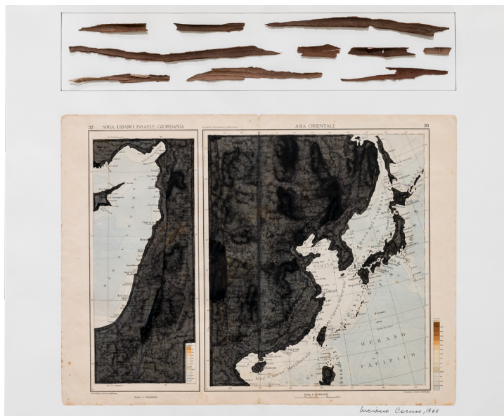
1. Luciano Caruso, Atlante / Siria, Libano, Israele, Giordania – Asia Orientale , 1966, collage, china e corteccia d'albero su carta, 60x49,5 cm.