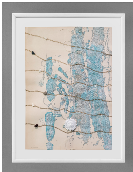
2. Luciano Caruso, La via della seta , 1993, collage, tempera, pennarello, inchiostro di china, spago, sassi, gesso e madreperla su carta, 47,5×67 cm.