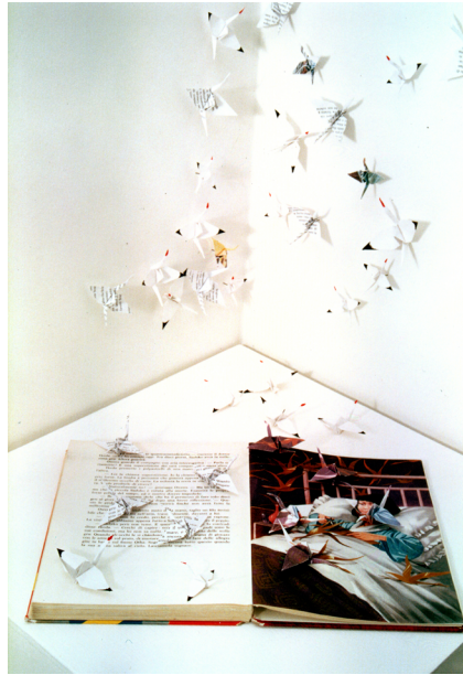
1. Sabrina Mezzaqui, Le mille gru , 1998, libro ( Il gran sole di Hiroshima ), 999 gru di carta ripiegata, dimensioni variabili.

illustrazioni del pittore Remo Squillantini assumono un peso preponderante se si pensa alla fruizione di Mezzaqui allora bambina, in età di scolarizzazione primaria, rispetto al corpo testuale. Nell'installazione, dalla pagina fuoriesce infatti uno stormo in carta bianca che si espande nello spazio espositivo a livello parietale, come se la storia prendesse forma nella realtà.