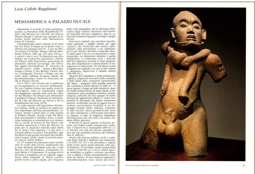
4. Licia Collobi, 'Mesoamerica a Palazzo Ducale', in Critica d'Arte , LIII, 18, 1988.

Centotrentasette opere esposte al di fuori del loro Paese d'origine per la prima volta, si afferma nel catalogo (AA. VV., L'arte del Messico prima di Colombo , Milano, Olivetti-Mondadori Editore, 1988, pp. 230, oltre 150 tavv. a colori) e non è vero. Si dimentica una affastellata, ma ricchissima esposizione a Roma, nel Palazzo delle Esposizioni, patrocinata da altrettanto eminenti personaggi, che offriva 866 oggetti precolombiani, in «missione di cultura» [...], con una scelta meno raffinata di questa attuale, ma documentatissima; alcuni ne troviamo anche in Palazzo Ducale.