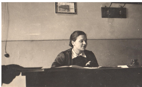
1. Fondazione Ragghianti, Archivio famiglia Ragghianti, Licia Collobi, storica dell'arte, Trieste 1914-Firenze 1989. Courtesy Fototeca Ragghianti.

to nel rivalutare le espressioni artistiche extraeuropee, sensibilizzando così lo sguardo inesperto — e talvolta scettico — dello spettatore, chiamato a confrontarsi con manufatti artistici lontani dai canoni estetici occidentali. Il lavoro critico di Licia Collobi su queste tematiche si articola principalmente su due binari: da una parte, il lavoro redazionale e la fervida produzione di recensioni, presenti in quasi tutti i numeri della sopracitata rivista seleArte , fondata nel 1952; dall'altra, la realizzazione di importanti progetti editoriali, in cui la studiosa compare sia come collaboratrice — come dimostrano le carte d'archivio relative al volume Museo Nazionale di Antropologia Città del Messico — sia come unica autrice, come nel caso del volumetto dedicato alle Civiltà Preincaiche 4 [fig. 1].