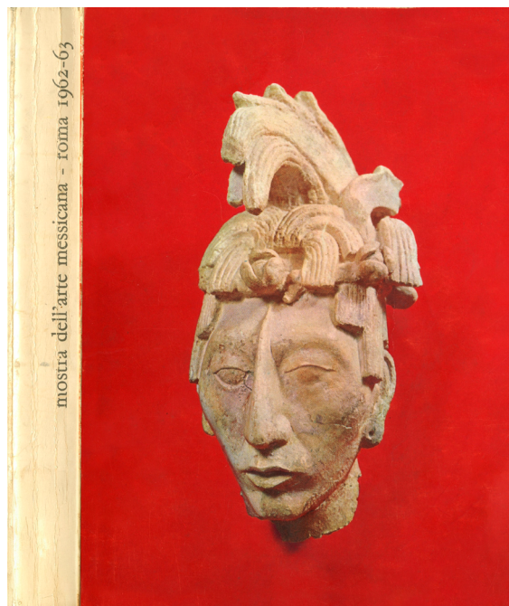
3. Catalogo della Mostra dell'arte messicana , Palazzo delle Esposizioni, Roma 1962-63.