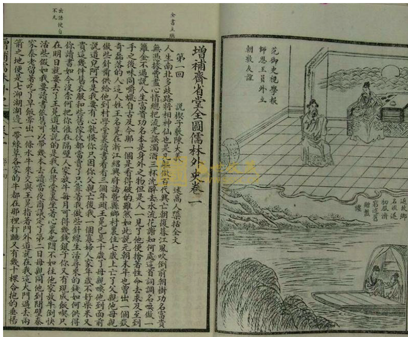
Figura 1: Es. di testo a stampa non punteggiato: Rulin wasihi 儒林外史 (Storia non ufficiale del bosco dei letterati), ed. Zengbu Qisheng tang 增补齊省堂 (Prefazione datata 1888).

Ricostruire lo sviluppo del sistema interpuntivo del cinese non è lo scopo del presente contributo; si intende però discutere e mostrare, attraverso una rapida introduzione alla questione e uno sguardo ad alcune fonti che risalgono ai primi decenni del '900, quando il dibattito sulla punteggiatura fu particolarmente intenso, come tali segni fossero percepiti come una importante novità e come siano ancora sentiti come una mescolanza di elementi autoctoni e stranieri.